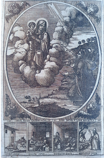
Նկ. 1. Գրիգոր Նարեկացու տեսիլը, Հակոբ Նալյան, Գիրք մեկնությունեան աղօթից սրբոյն Գրիգորի Նարեկացւոյ, Կ. Պոլիս, 1745 թ., էջ 18

(Մանրանկարներից մինչև Մխիթարյան հայրերի հրատարակությունների փորագրանկարներ)