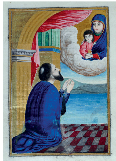
Նկ. 4. Վնտկ. 603, Կ. Պոլիս, 1762 թ., էջ 328