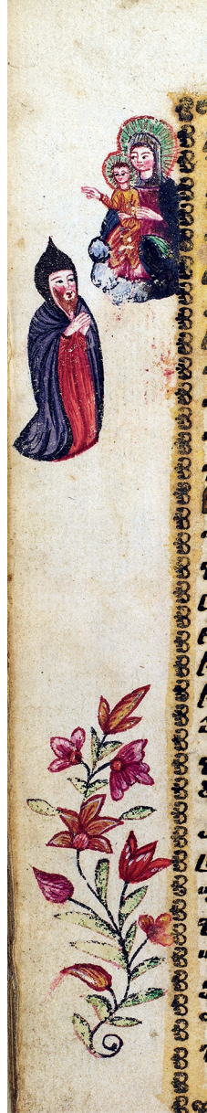
Նկ. 6. ՄՄ 10909, Կ. Պոլիս, 1782 թ., 237բ