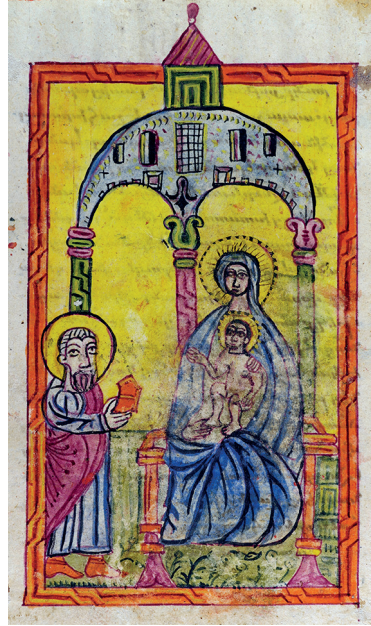
Նկ. 9. ՄՄ 5087, 1694 թ., Կտուց անապատ