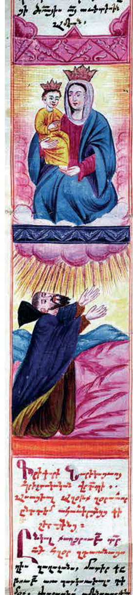
Նկ. 7. ՄՄ հմլլ. 502, 1778 թ.