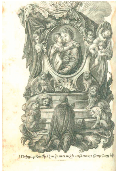
Նկ. 11. Բանք արդժից, Վենետիկ, 1763 թ., էջ 122

Առեցւ. ք. Տամբրձիւն. ք. արուշի ակնուոյ շնորհաց նմ.