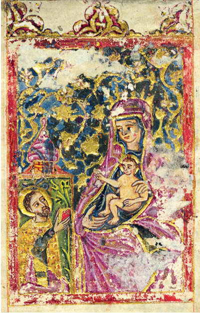
Նկ. 8. ՄՄ 5650, ԺԵ. դ., 1բ