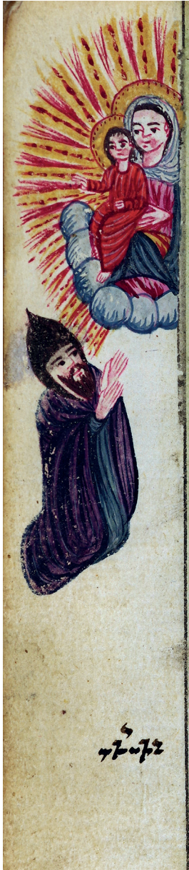
Նկ. 5. ՄՄ 8422, Կարին, 1778 թ., 80բ