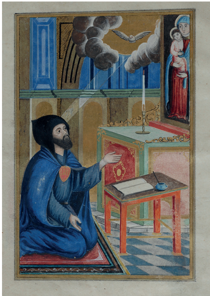
Նկ. 10. Վնակ. 603, Կ. Պոլիս, 1762 թ., էջ 2