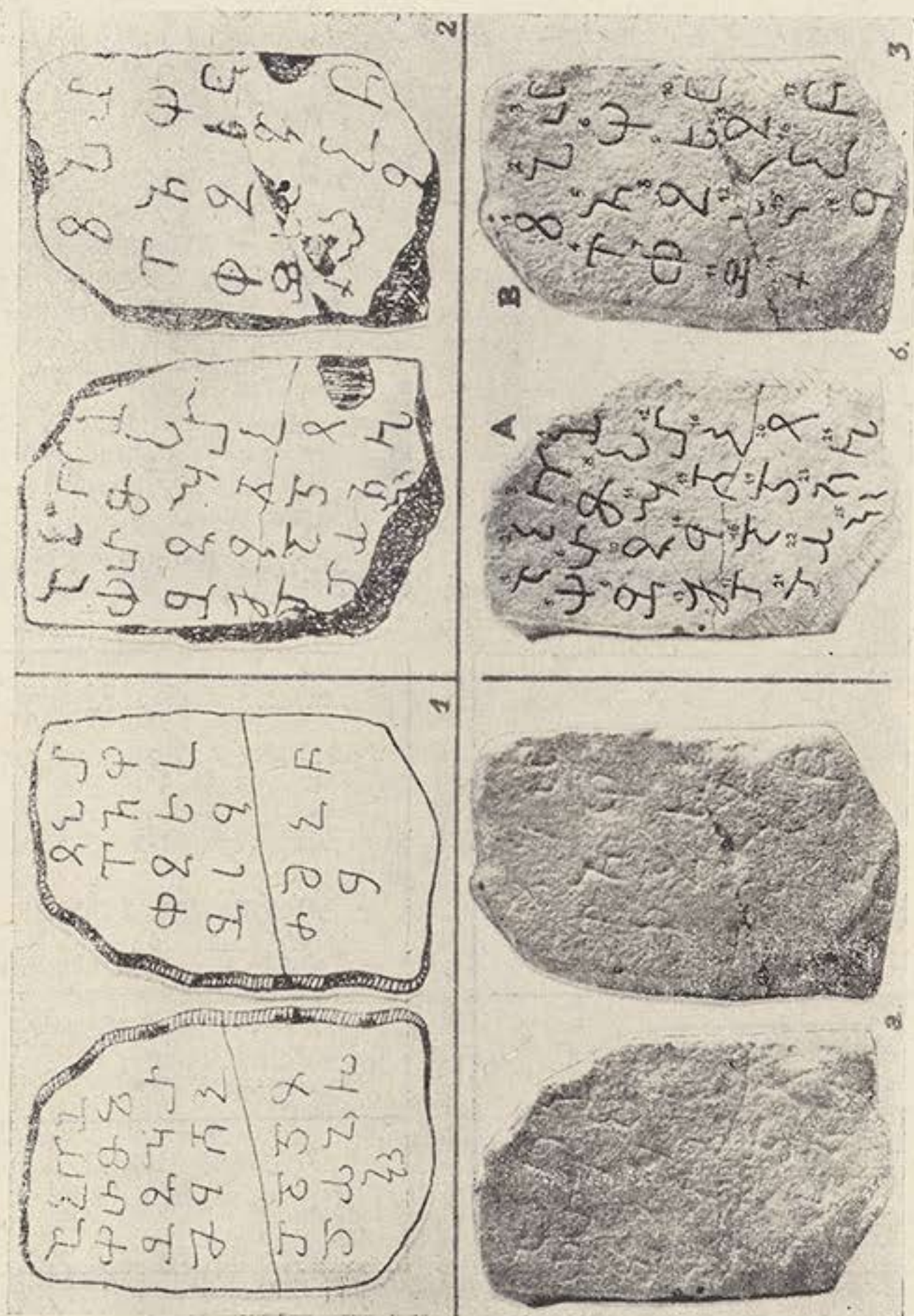
Рис. 1—3. Табличка из Верхнего Лабкомахи: 1—по В. Л. Гукасяну (1971); 2—по Г. А. Климову (1976 г.); 3—по муляжу А. Г. Шаидзе (1971): фото без прорисовки (а) и с прорисовкой и нумерацией знаков (б). (См. прим. 8).